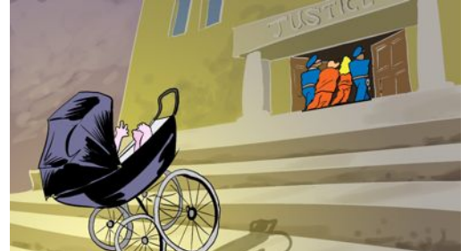
"Child's Odessa-y" par Spiros Derveniotis, Greece ( www.cartoonmovement.com )

le magazine des étudiants du Mouvement Chrétien au Royaume Uni.